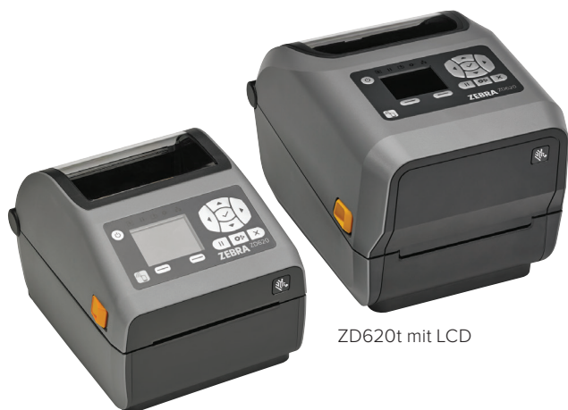
ZD620d mit LCD

Wenn Druckqualität, Produktivität, Anwendungsflexibilität und einfache Verwaltung eine hohe Priorität haben, ist der Zebra ZD620 die erste Wahl. Der ZD620, der die neue Generation der Desktopdrucker-Reihe von Zebra darstellt, löst die beliebte GX-Serie und den ZD500 ab. Mit seiner überragenden Druckqualität und hochmodernen Features bietet er weitaus mehr als herkömmliche Desktopdrucker. Der als Thermodirekt- und Thermotransfer-Modell sowie als Spezialmodell für das Gesundheitswesen erhältliche ZD620 erfüllt eine Vielzahl von Anwendungsanforderungen. Er bietet mehr Standardfunktionen als jeder andere Zebra-Desktopdrucker sowie ein optionales Bedienfeld mit zehn Tasten und LCD-Farbdisplay, das Druckereinstellung und Statusprüfung zum Kinderspiel macht. Der ZD620 nutzt Link-OS® und wird von unserer leistungsstarken Print DNA-Suite mit Anwendungen, Dienstprogrammen und Entwicklertools unterstützt, die durch bessere Performance, einfachere Fernverwaltbarkeit und unkomplizierte Integration für ein überzeugendes Druckerlebnis sorgt. Der ZD620 von Zebra bietet die Druckgeschwindigkeit, Druckqualität und Verwaltbarkeit, die Ihr Unternehmen voranbringt.